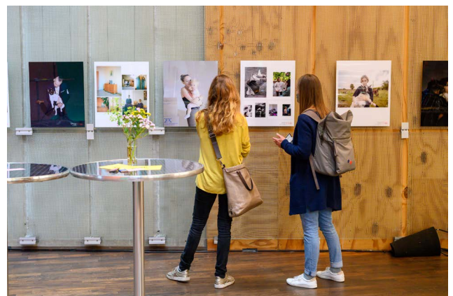
Preview-Tag, „NEXT! -Festival der Jungen Photoszene“ im Mediapark im Oktober 2020.

„NEXT! Das Festival der Jungen Photoszene“ wird 2021 von der Internationalen Photoszene Köln gemeinsam mit dem Deutschen Kinder- und Jugendfilmzentrum (KJF) sowie der SK Stiftung Kultur und dem jfc Medienzentrum ausgerichtet.