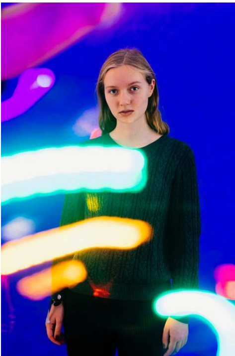
Portrait, entstanden im Pop-Up-Studio während des NEXT- Preview-Tages im Oktober 2020.

Neben dem etablierten Photoszene-Festival wird es im Jahr 2021 ein ganz neues Format geben: „NEXT! Das Festival der Jungen Photoszene“.